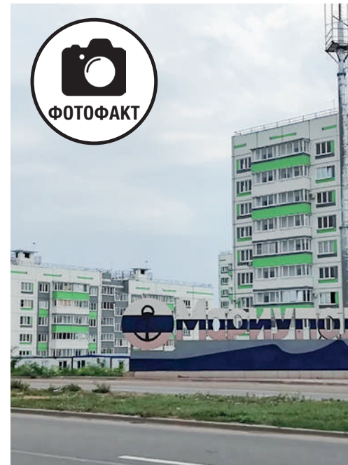
Новый микрорайон Мариуполя.