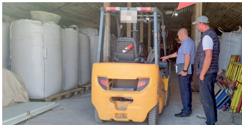
С начала года предприниматели Крыма получили 1 млрд рублей на развитие и ведение бизнеса.

предпринимательство», ставшего структурной составляющей нового нацпроекта «Эффективная и конкурентная экономика». Организация помогает крымским производителям расширять основные фонды на льгот-