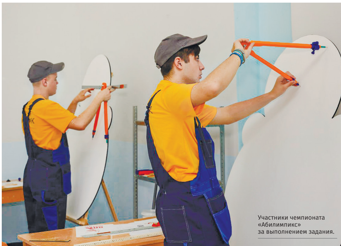
Участники чемпионата «Абилимпикс» за выполнением задания.

■ В Государственном академическом музыкальном театре Республики Крым была презентована историко-документальная выставка «К 80-летию Победы в Великой Отечественной войне. Наша сила – в исторической правде», где были представлены директивные документы Государственного комитета обороны СССР, приказы командования Крымского фронта, материалы партизанского движения и подпольной борьбы, а также документы о восстановлении народного хозяйства после освобождения Крыма. Экспозиция призвана продемонстрировать неоценимый вклад крымчан в разгром нацистской Германии и её союзников.