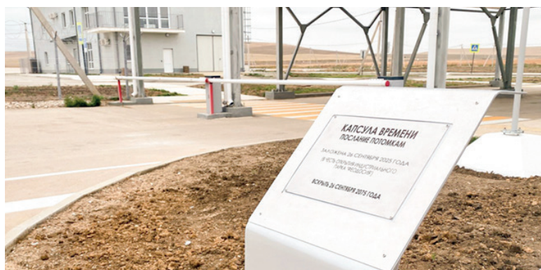
Индустриальный парк «Феодосия» создаст более тысячи рабочих мест и привлечёт инвесторов.

■ Крым вновь стал победителем федерального конкурса на