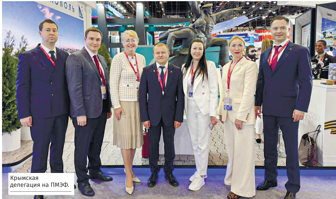
Крымская делегация на ПМЭФ.

■ В Симферополе завершилось строительство новой транс-