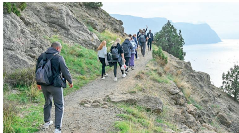
В Крыму на 20% увеличился турпоток по сравнению с 2024 годом.

Кроме того, охватили восточный и западный обходы Симферополя. Общий объём финансирования – 81 млн рублей. Протяжённость освещаемых участков – 7,4 км.