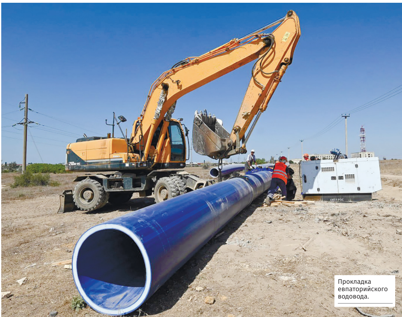
Прокладка евпаторийского водовода.

■ В Симферопольском районе обновили оборудование десяти трансформаторных подстанций. Из-за зимних нагрузок на электросети поступало много жалоб, поэтому дополнительно выделили 30 млн рублей. Работы завершили на 18 объектах.