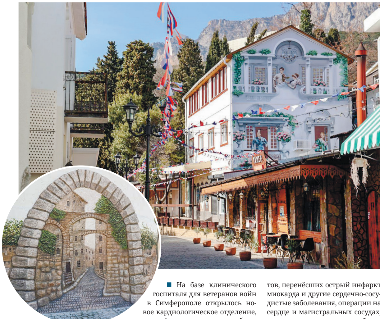
Восхитительные преобразования Алупки.

■ На базе клинического госпиталя для ветеранов войн в Симферополе открылось новое кардиологическое отделение, оснащённое современным оборудованием. Отделение рассчитано на 15 коек и принимает пациен-