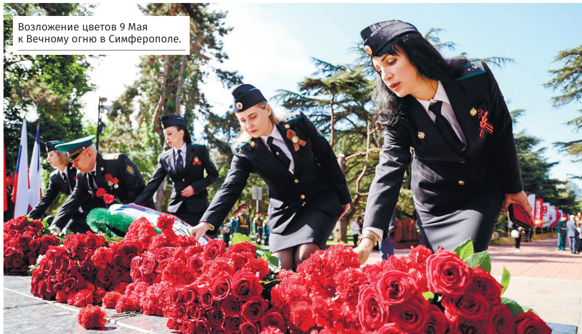
Возложение цветов 9 Мая к Вечному огню в Симферополе.