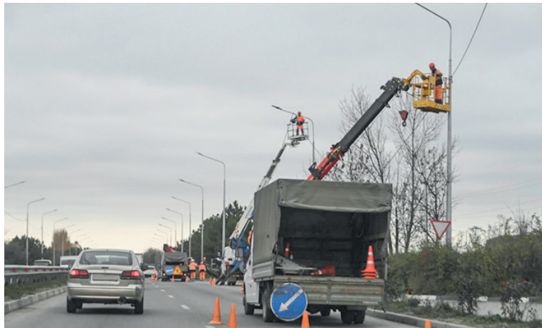
В Крыму в разгаре масштабный проект по строительству систем наружного освещения на автодорогах.

■ На территории 7-й городской клинической больницы Симферополя начаты подготовительные работы по строительству модульного приёмного отделения для оказания экстренной медицинской помощи. Этот уникальный проект, реализуемый в рамках нацпроекта «Продолжительная и активная жизнь», изменит экстренную медицинскую помощь в Крыму. Отделение оснастят современным медицинским оборудованием, и в одном здании будут объединены все ключевые