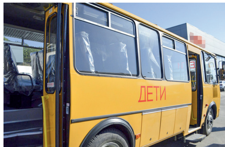
Крым получил 40 новых школьных автобусов ПА3.

сельхозтехнику – от дождевальных поливочных машин до высокомоментных тракторов. Региональная лизинговая компания РК действует в рамках федерального проекта «Малое и среднее