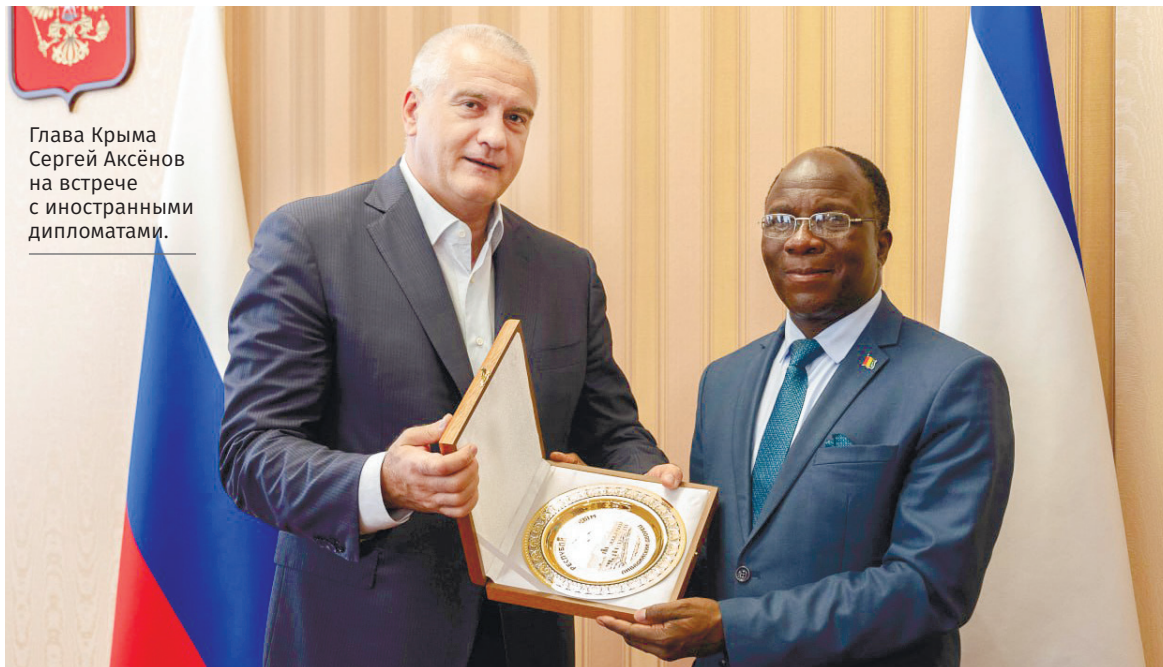
Глава Крыма Сергей Аксёнов на встрече с иностранными дипломатами.

■ Министр науки и высшего образования РФ Валерий Фальков посетил КФУ имени В. И. Вернадского. Студенты представили научные наработки в сферах