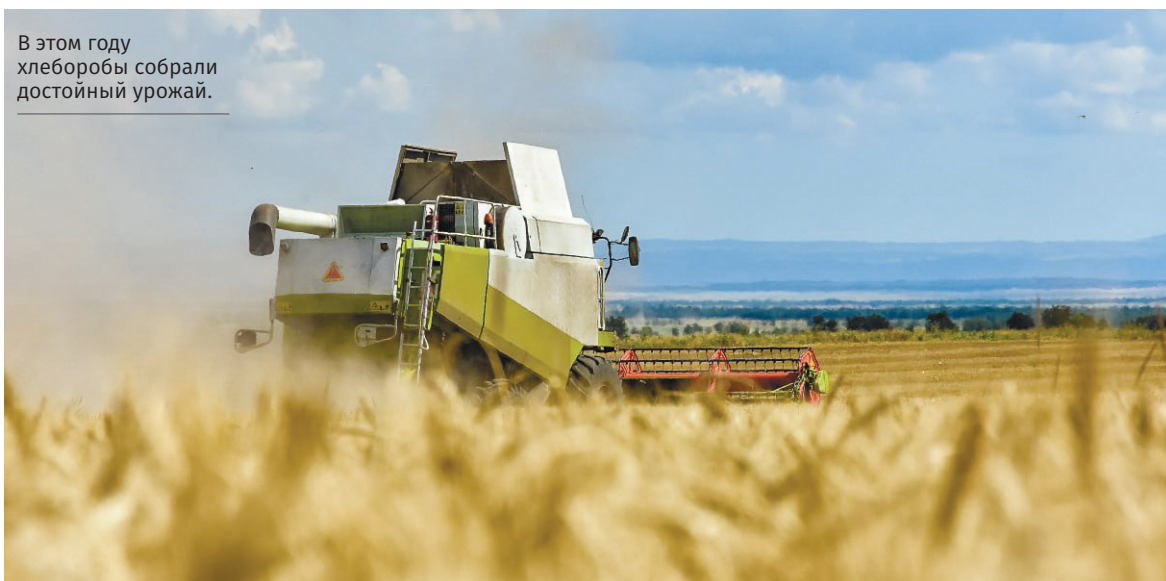
В этом году хлеборобы собрали достойный урожай.

■ В Ялте открылся новый комплекс для размещения подразделений Роствардии, что повышает уровень несения службы бойцами. 15 квартир данного имущественного комплекса переданы Ялтинскому муниципальному округу для распределения между детьми-сиротами и нуждающимися в переселении из аварийного жилья.