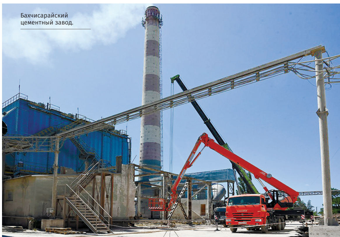
Бахчисарайский цементный завод.

■ Бахчисарайский цементный завод побил свой рекорд, выпустив более 589 тысяч тонн цемента впервые за всю историю завода – с 1953 года. Предприятие участвовало в федеральном проекте «Производительность труда». За шесть месяцев удалось ускорить процессы на 29,3% и увеличить выпуск продукции на 17%. Бережливое производство и модернизация оборудования позволили существенно повысить объёмы и качество.