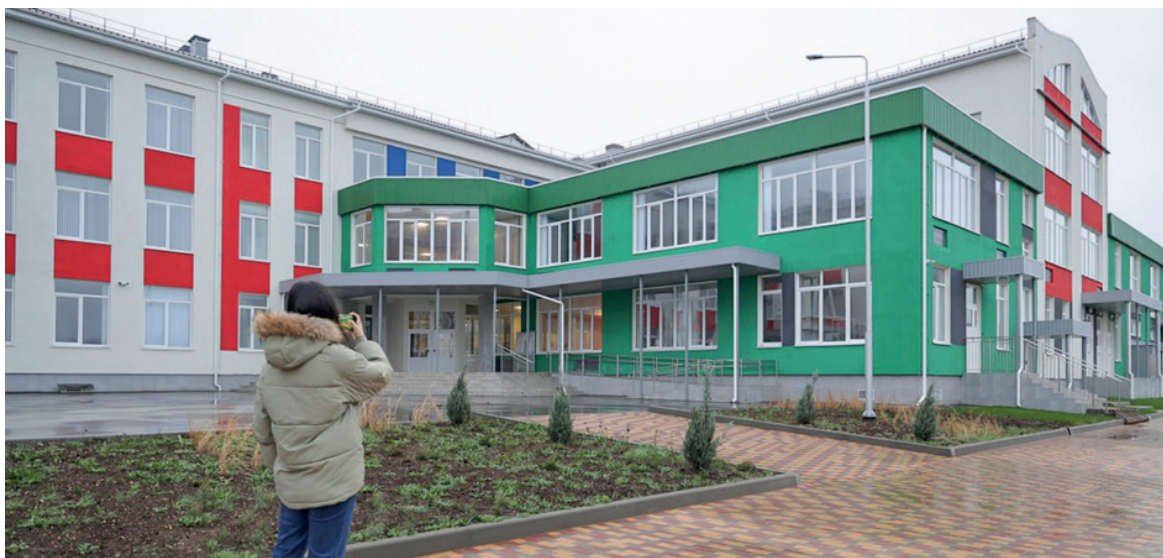
Наш корреспондент перед новой супершколой в селе Укромном.

■ В Большой Ялте и на территории Судакского городского округа обновили энергетическую инфраструктуру, подготовив её к зимним нагрузкам. На территории Ялтинского городского округа в 2025 году отремонтировали 331 кабельную линию электропередачи, заменили 60 опор, провели капитальный ремонт 90 трансформаторных подстанций и расчистили 13 гектаров трасс ЛЭП от растительности. Под Судакком, в сёлах Ворон и Громовка, провели подключение электроэнергии к двум модульным пунктам первичной медико-санитарной помощи. К подаче ресурса подключили и Дом культуры в Грушевке.