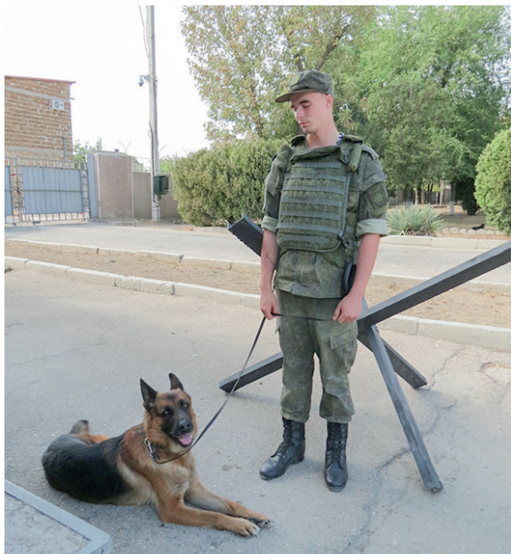
Агат несёт службу на КПП.