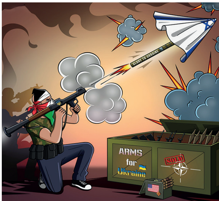
Карикатура: телеграм-канал «Честный художник»

*** У армянского радио спросили: – Нужно ли передавать привет знакомым толкиенистам? Армянское радио ответило: – Не нужно: они и так с приветом! *** – Кукушка, кукушка... Сколько мне жить осталось? – Долго... Ты ещё кредит не выплатил.