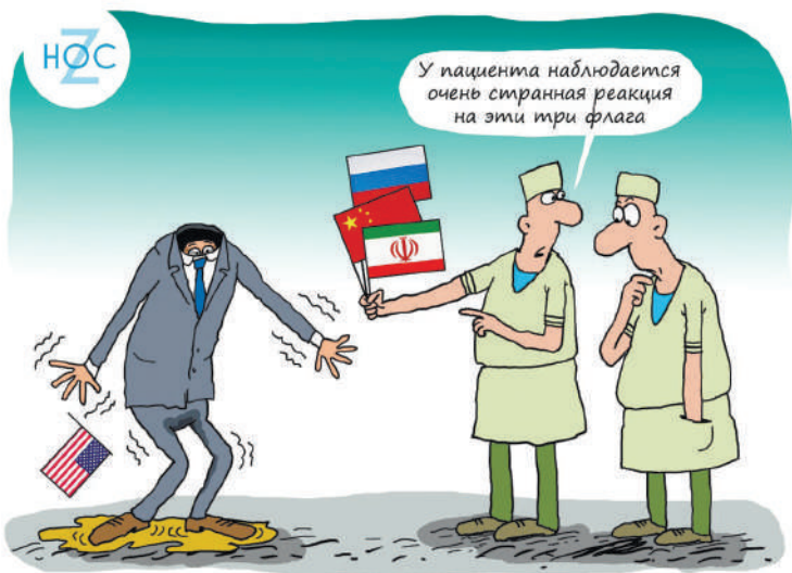
Карикатура: телеграм-канал «НОС»