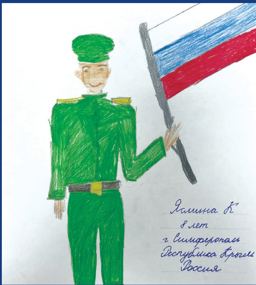
Алимина К. 8 лет г. Симферополь Республика Крым Россия