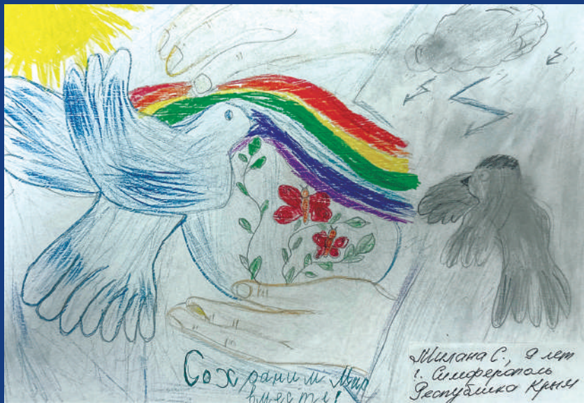
Милана С., 9 лет, Симферополь Республика Крым