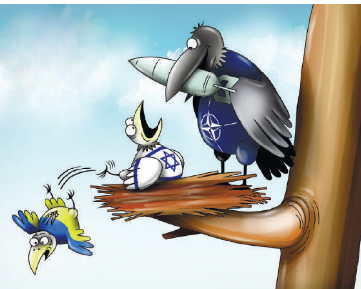
Карикатура: телеграм-канал «Регнум»