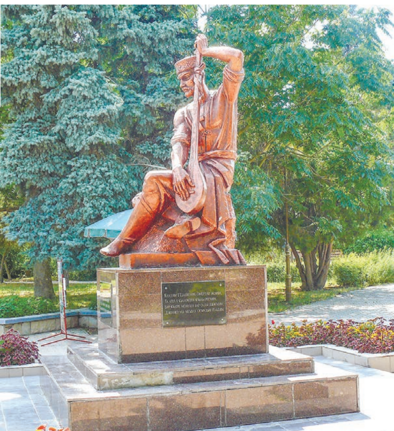
Памятник народному сказителю, средневековому артисту Омеру украшает центр Евпатории.