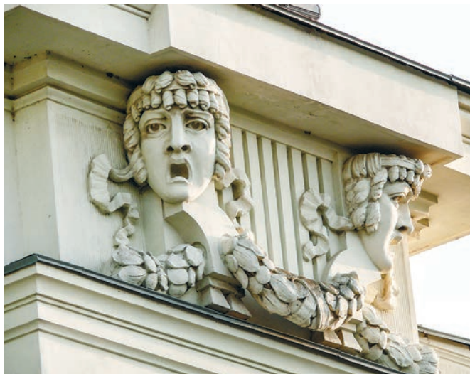
Фасад «храма Мельпомены» в Евпатории украшают маски трагедийных персонажей.

Достоинным продолжателем идей Древней Греции, но уже в эпоху Серебряного