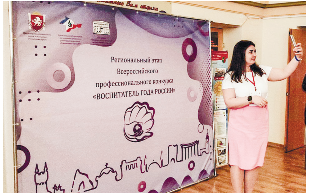
В этом году за звание воспитателя года в Крыму поборются 10 педагогов дошкольного образования.