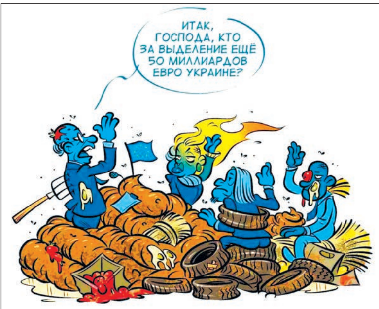
Карикатура: телеграм-канал «Нос»

– Например что? – Много всего. Теперь и не вспомнишь.