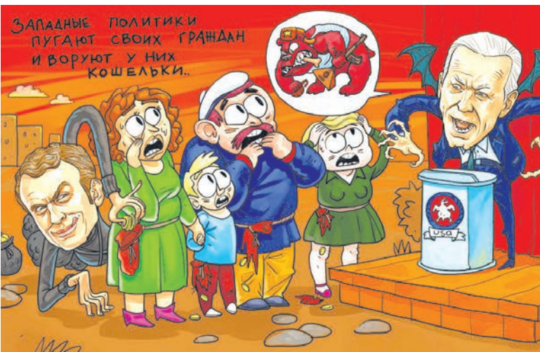
Карикатура: телеграм канал «Нос»