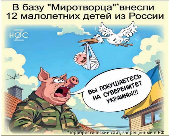
Карикатура: Телеграм-канал «НОС»

*** Исландские учёные открыли новый вулкан. Чтобы его назвать, они по очереди спали на клавиатуре. *** – Чем отличается женщина от такси? – Женщина с огоньком никогда не бывает свободной. *** – О боже! Мне так плохо, кажется, я сейчас умру. Что со мной? – Успокойся, это просто 7 утра и тебе пора на работу. *** – А что ты больше любишь – меня или суп? – Первое. *** – Что, красавица, прокатимся с ветерком? – Не могу: остеохондроз. *** – Искупаемся в речке? – Не могу: ревматизм... – В баньке попаримся? – Не могу: сердце колет... – Что же ты такая больная глазки строила?! – Так косоглазие. *** Чтобы слова не расходились с делом, нужно молчать и ничего не делать. *** Мой дед говорил: «Когда одна дверь закрывается, другая открывается». Хороший был дед. А вот шкафы плохо собирали. *** Крепкая семья – это когда она красивая, а он всегда немножечко виноватый. *** Самое ужасное в расставании – это что автозамена продолжа-