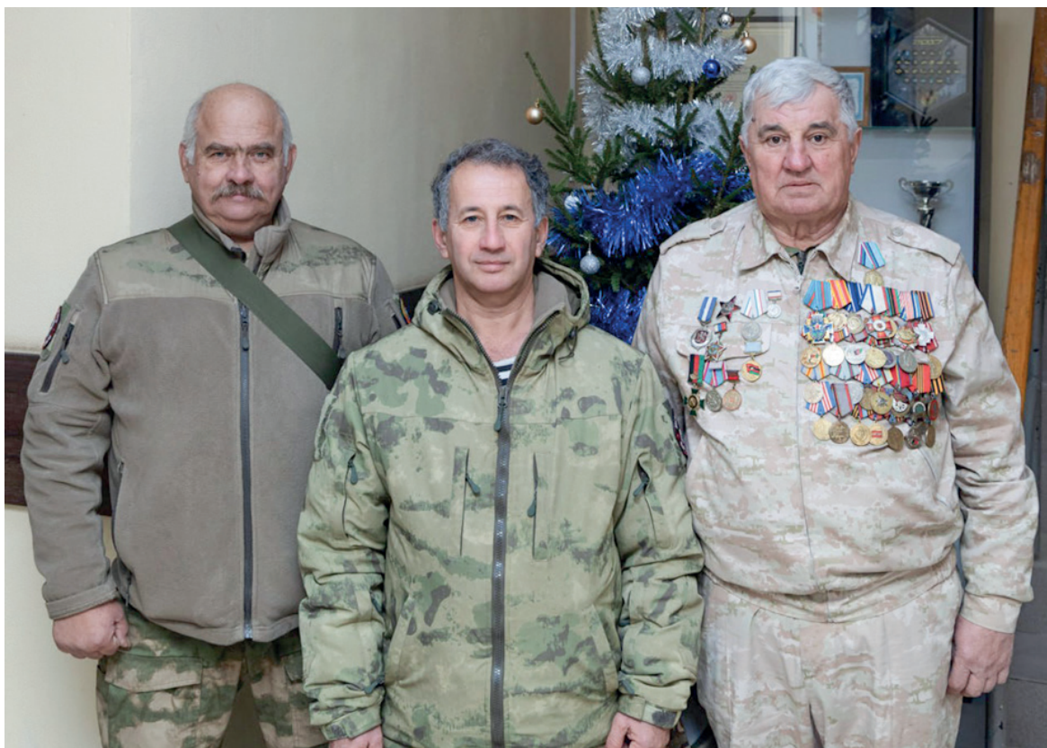
Зимние праздники ветераны встретят на боевом посту, защищая важные объекты полуострова.

Фото Михаила ГЛАДЧУКА, героев публикации.