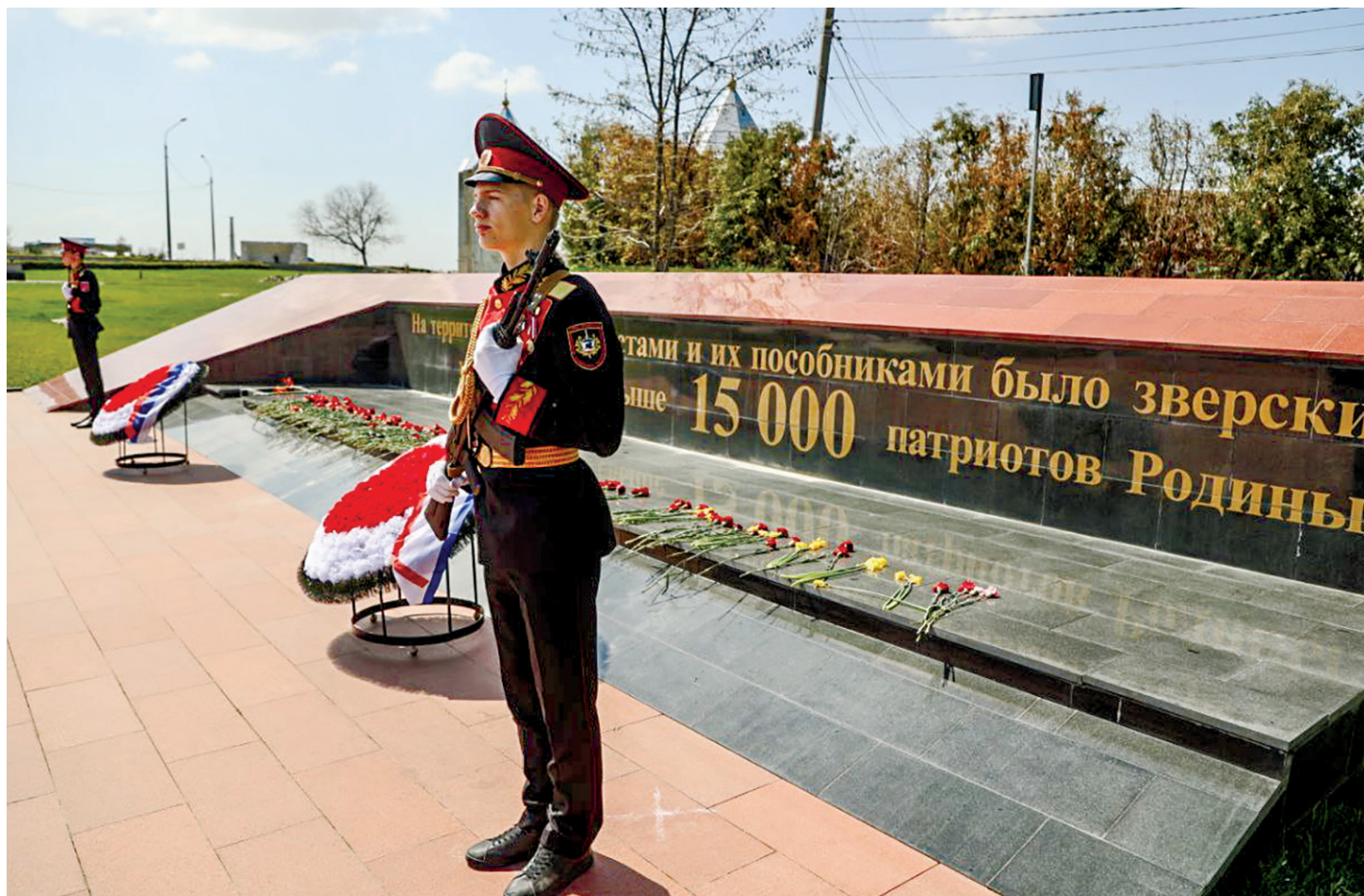
В мемориальном комплексе «Концлагерь «Красный» в Симферополе возложили цветы в память узников фашистских концлагерей.

Николай ПАТРУШЕВ, секретарь Совета безопасности РФ.