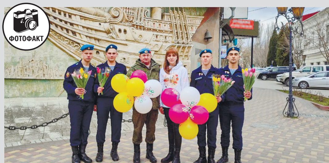
Отголоски праздника: военнослужащие 56-го гвардейского десантно-штурмового полка поздравляли жительниц Феодосии с 8 Марта.

Региональное отделение Российского военно-исторического общества в городе Севастополе объединяет более 150 граждан – профессиональных историков и любителей военной истории. В состав Совета РО РВИО входят руководители как крупнейших федеральных, так и негосударственных музеев в Севастополе, представители Черноморского флота, научные сотрудники. Ретрокинотеатр «Украина» стал местом, где региональное отделение РВИО проводит выставки и экспозиции, патриотические мероприятия. В частности, здесь уже были представлены экспозиции, посвящённые адмиралу Фёдору Ушакову, героям первой и второй оборон Севастополя и СВО, выставки детских рисунков, а также проводился сбор писем и поздравлений российским бойцам.