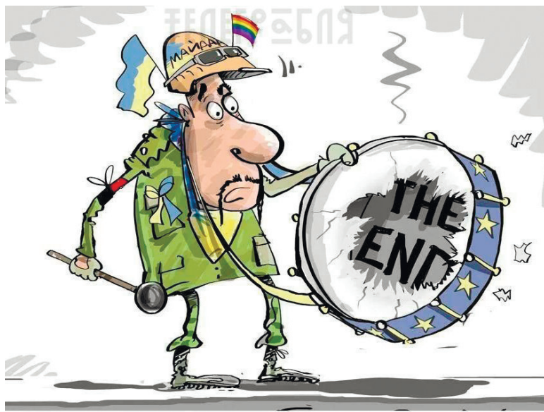
Карикатура: Телеграм-канал «Телерабл»