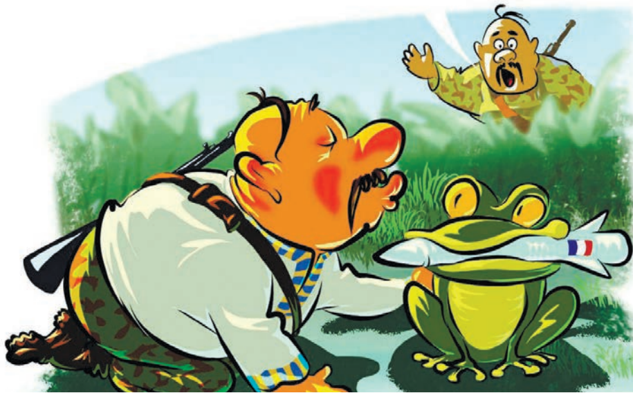
Карикатура: телеграм канал «kukuffka»

МЫКОЛА, ЦЕ НЕ ПРИНЦЕССА! ТО МАКРОН ДОПОМОГУ ПРИСЛАД!