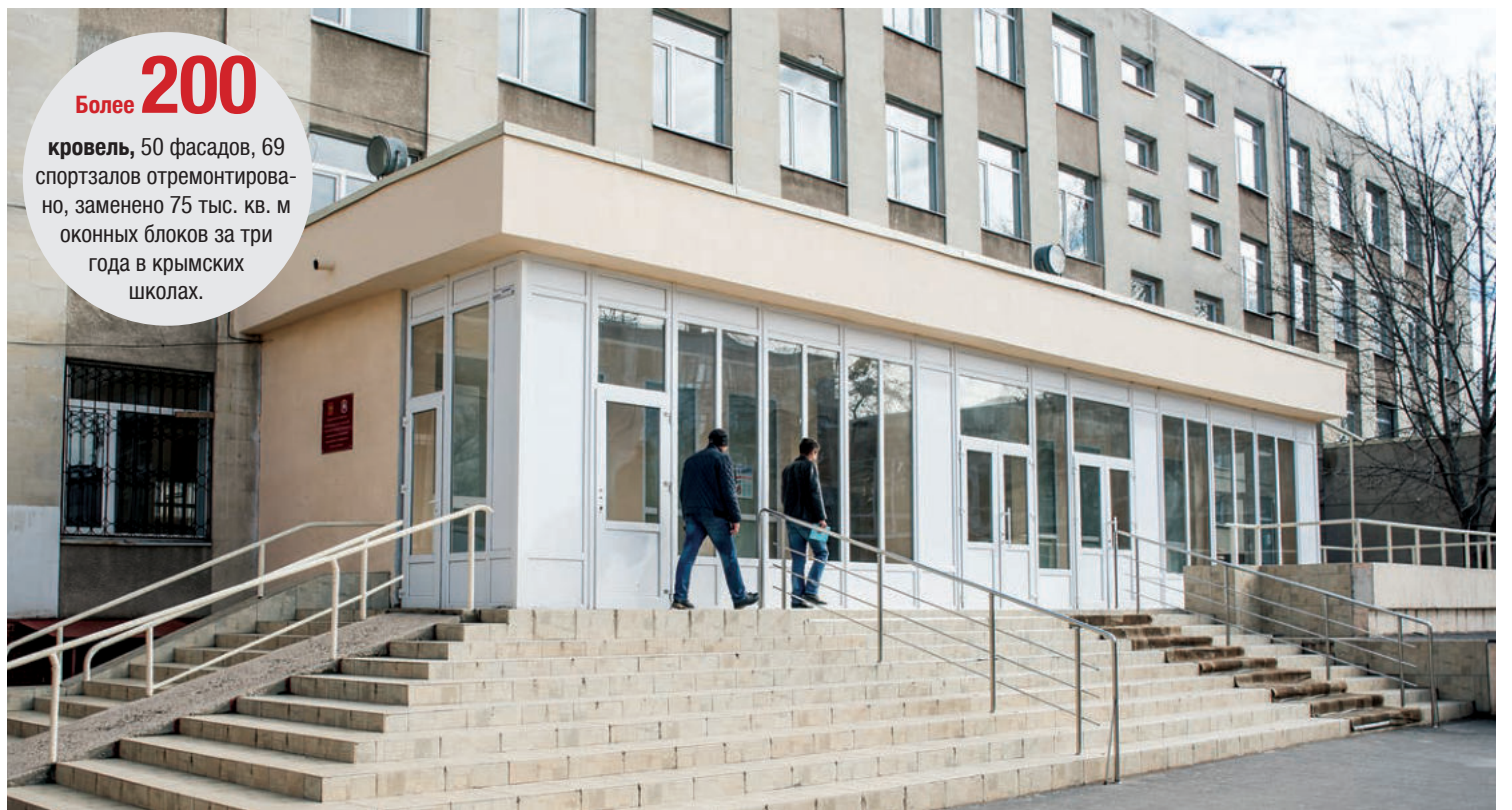
Капитальный ремонт проведён и в симферопольской гимназии № 1. Здесь заменили окна, коммуникации, отремонтировали спортзал.

Всё больше крымских выпускников выбирает ЕГЭ. Но и ГВЭ считается