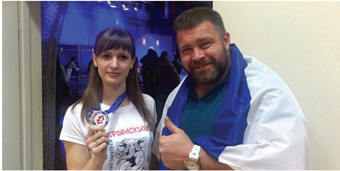
Крымские спортсмены завоевали три медали на чемпионате России по армспорту среди взрослых.

К онкурировать нашим рукоборцам пришлось с едва ли не лучшим за последние годы составом участников. Причём награды наши земляки завоевали и в тех видах, где от них такой прыти никто не ожидал.