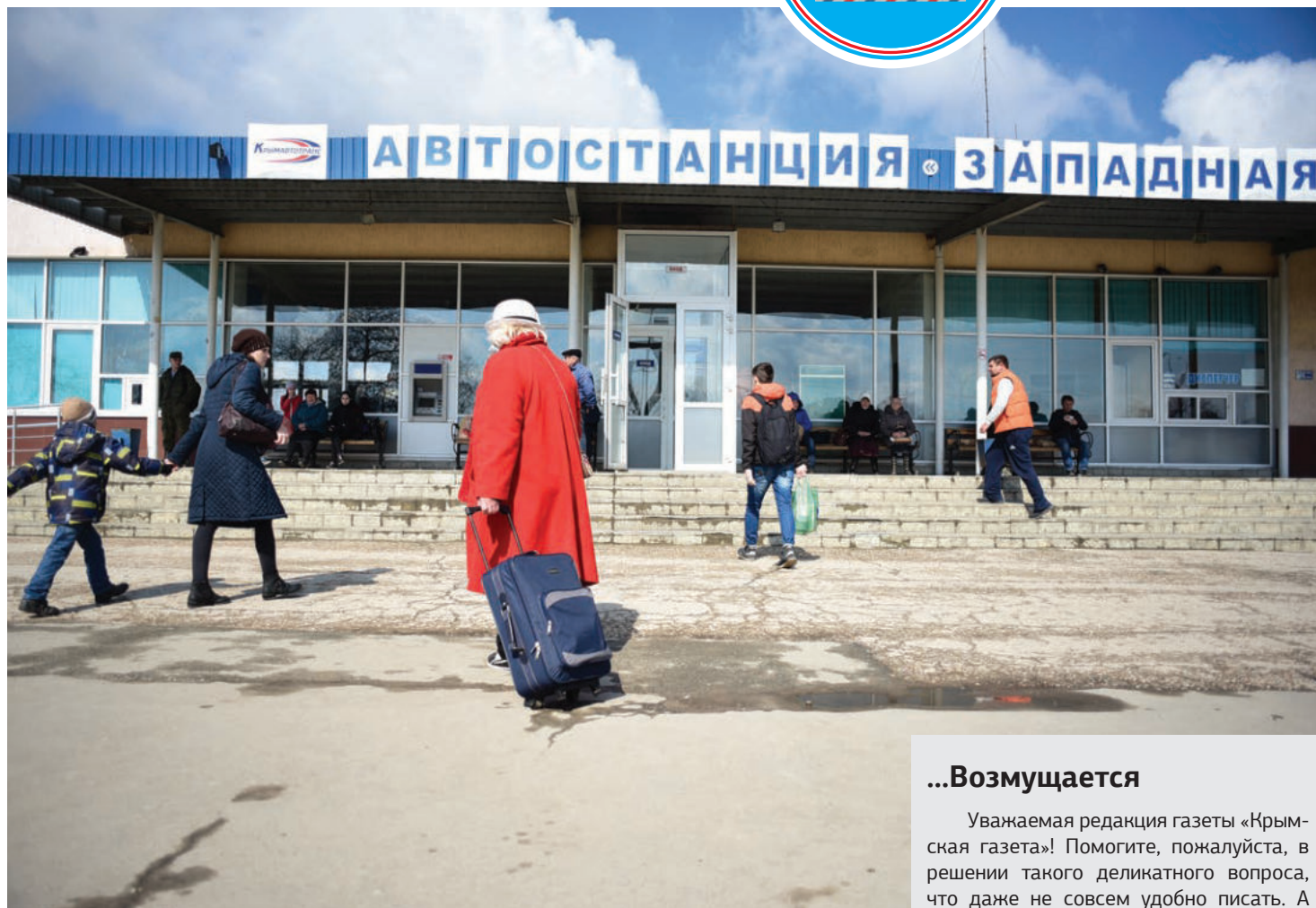
На автостанции «Западная» в Симферополе всегда много пассажиров.

Кто-то сказал, что негодяи приедут к нам обливать бюллетени зелёной. Но ни капли страха не было ни у кого. Готовы были стать стеной, но референдум не отдавать! После окончания голосования за-