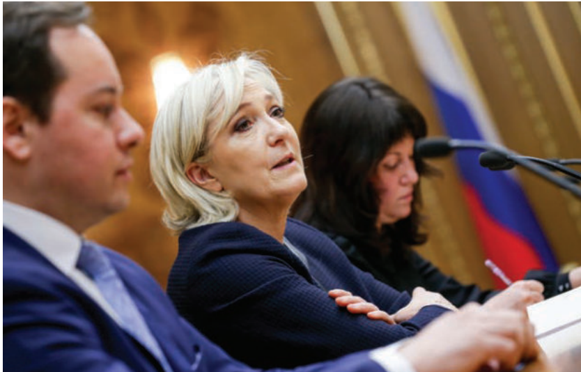
Марин Ле Пен на заседании комитета Госдумы РФ по международным делам.

Визит Марин Ле Пен – один из главных этапов её избирательной кампании