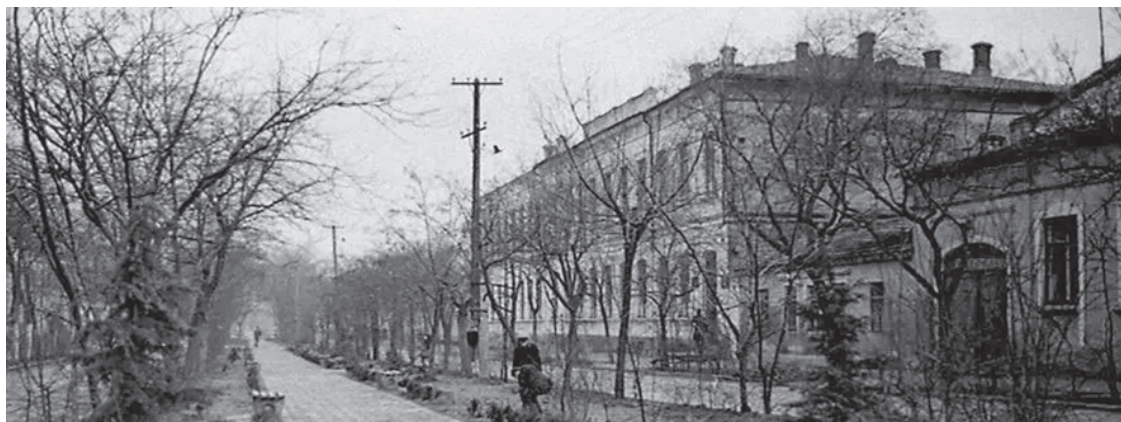
1970–1979, Улица Вити Коробкова.