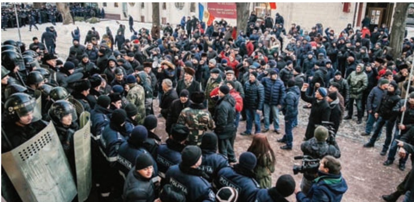
24 апреля. Акция протеста у здания парламента в Кишинёве.