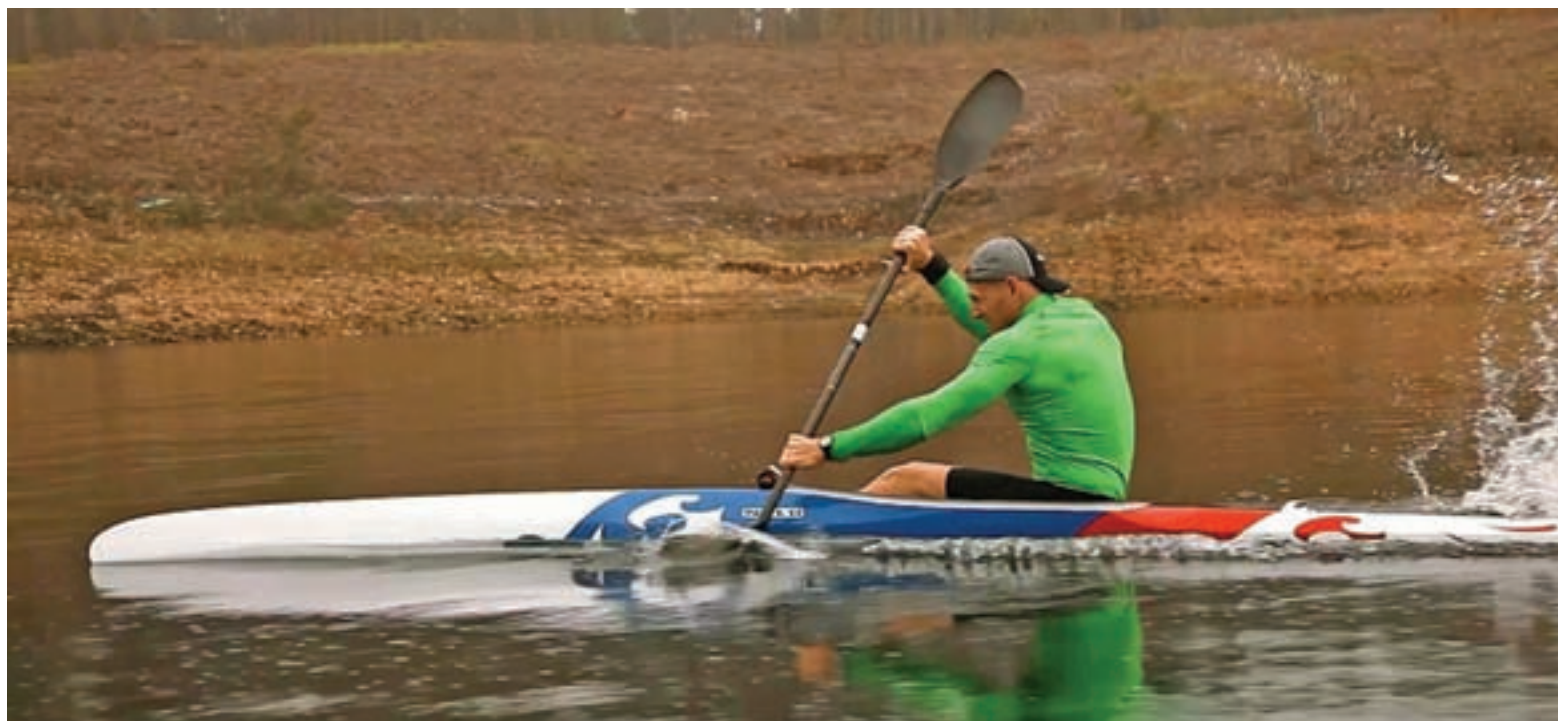
Соревнования по гребле на байдарках и каноэ прошли в Симферополе впервые за 40 лет.

танции: 200 метров, 500 и один километр. Водный вид спорта требует в первую очередь физических данных, ведь во время гребли задействованы все группы мышц. Чтобы прийти первым, надо сосредоточиться. Поэтому рассмотреть крымские пейзажи спортсмены могут только во время разминки. Поболеть за ребят пришли не толь-