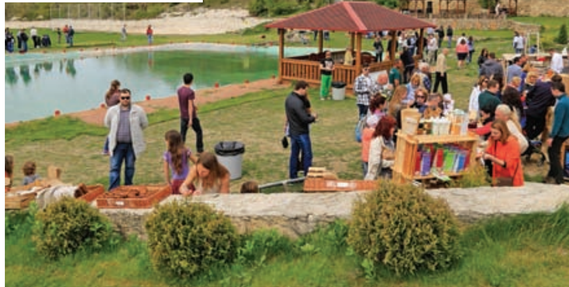
Фестивали семейного отдыха становятся всё более популярными в Крыму.