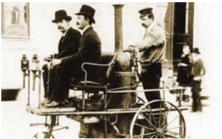
Впереди – водитель, сзади – шофёр.

Словом «шофёр» изначально называли людей, которые не управляли транспортным средством, а подбрасывали уголь