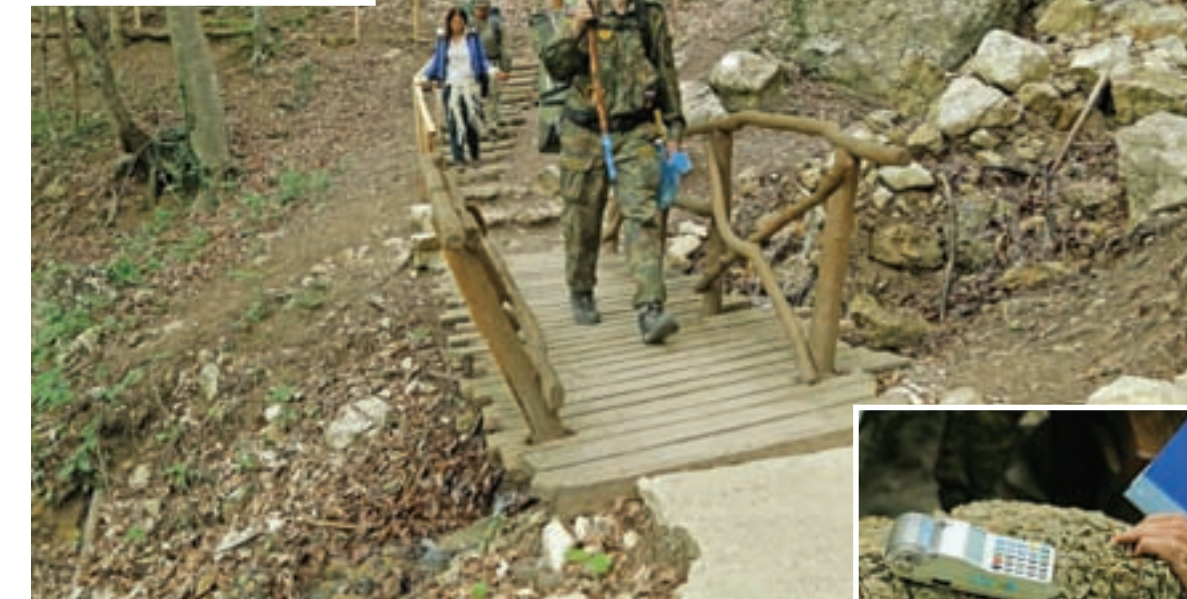
Первые туристы уже опробовали реконструированную тропу в Большом каньоне. Бесплатно пройти не удастся.