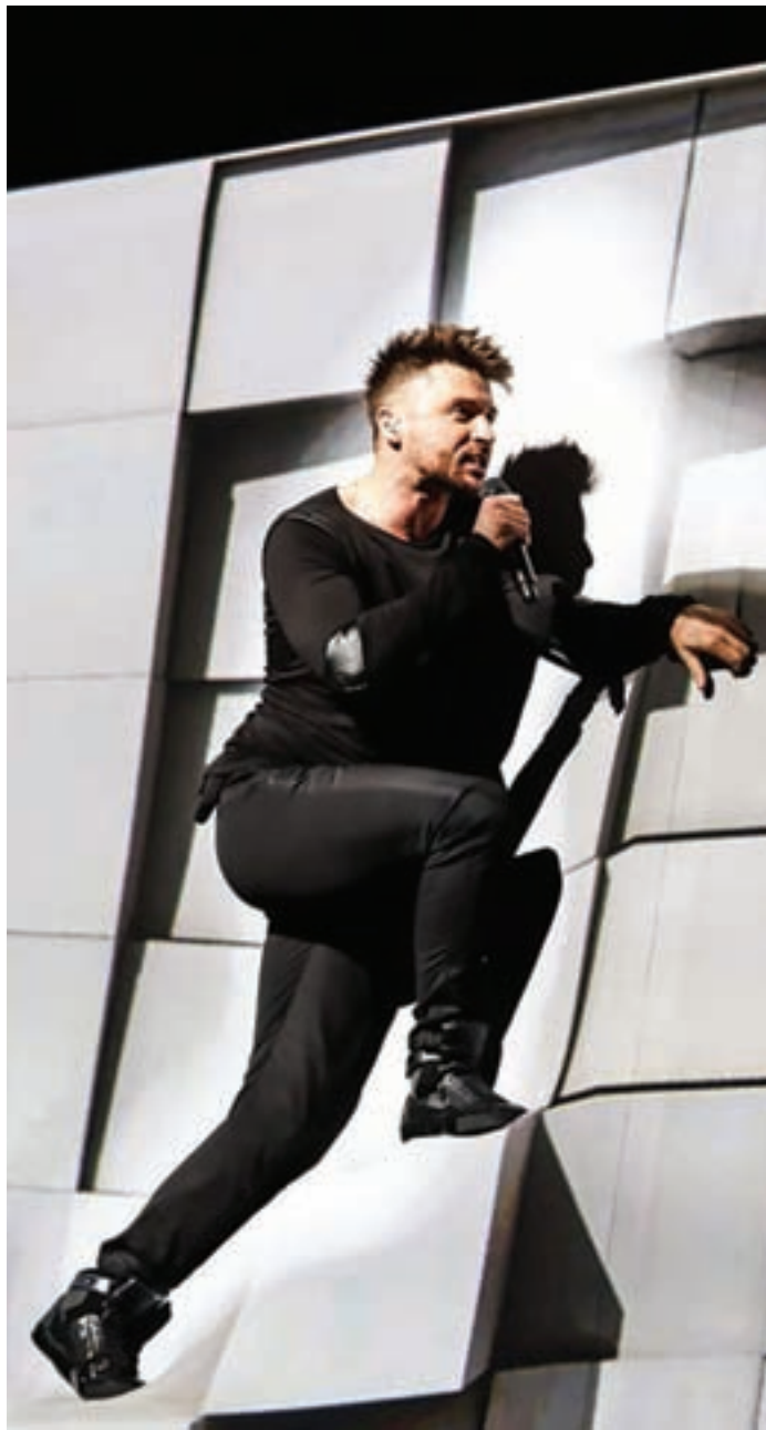
По результатам зрительского голосования Сергей Лазарев занял первое место