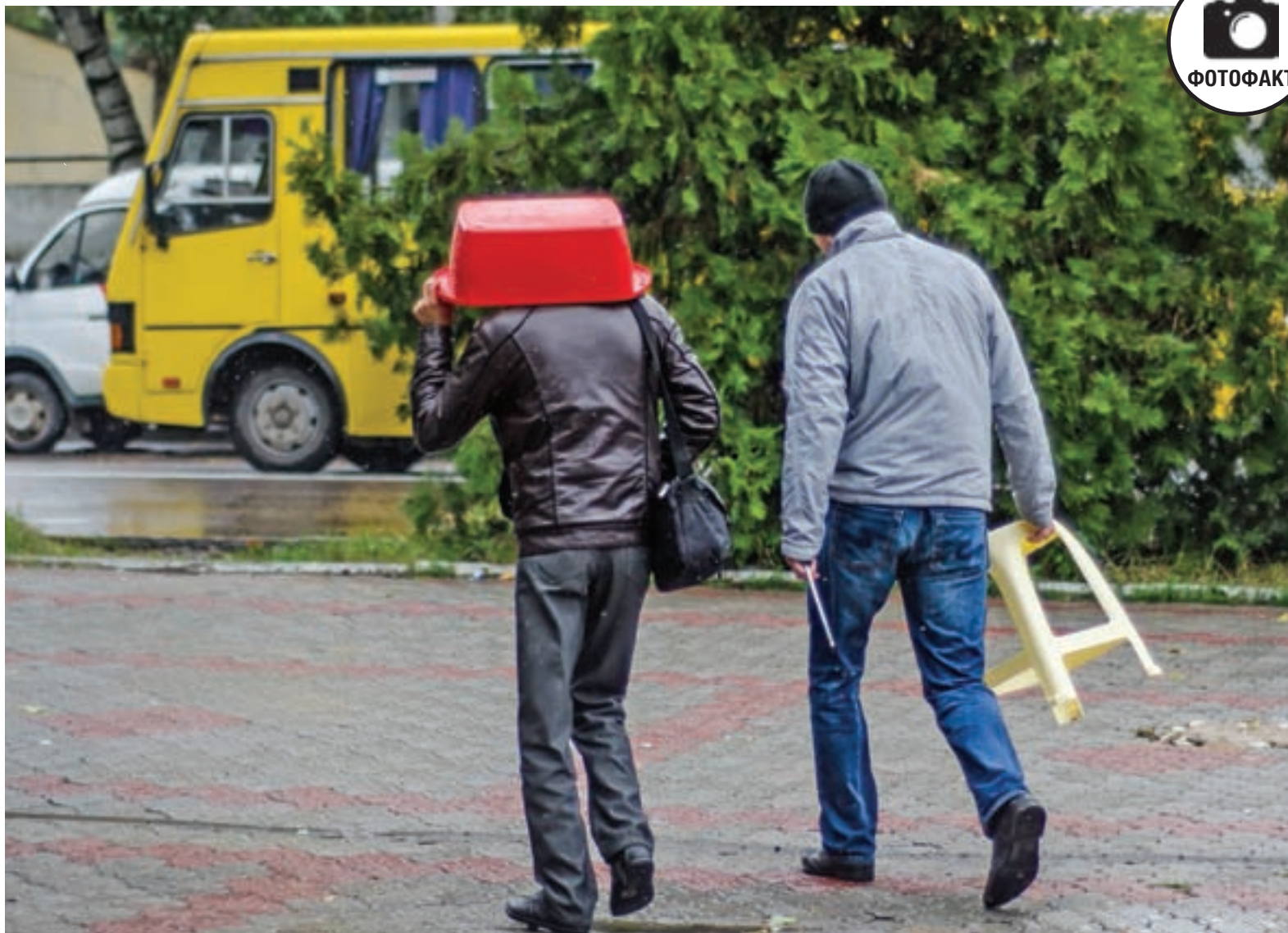
Дожди в Крыму идут почти каждый день, но всегда неожиданно.

Оформить подписку можно в любом отделении связи Крыма