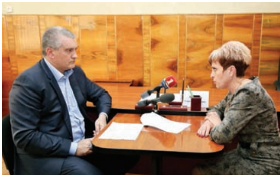
Бахчисарай. 8 апреля. Глава РК Сергей Аксёнов ведёт личный приём бахчисарайцев.

В 15-дневный срок вам придёт приглашение с датой личного приёма либо ответ на вопрос, который может вас вполне удовлетворить.