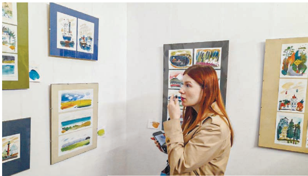
Красочные рисунки позволяют совершить путешествие в детство.

Это небольшие путевые зарисовки севастопольской художницы Евгении Русиновой .