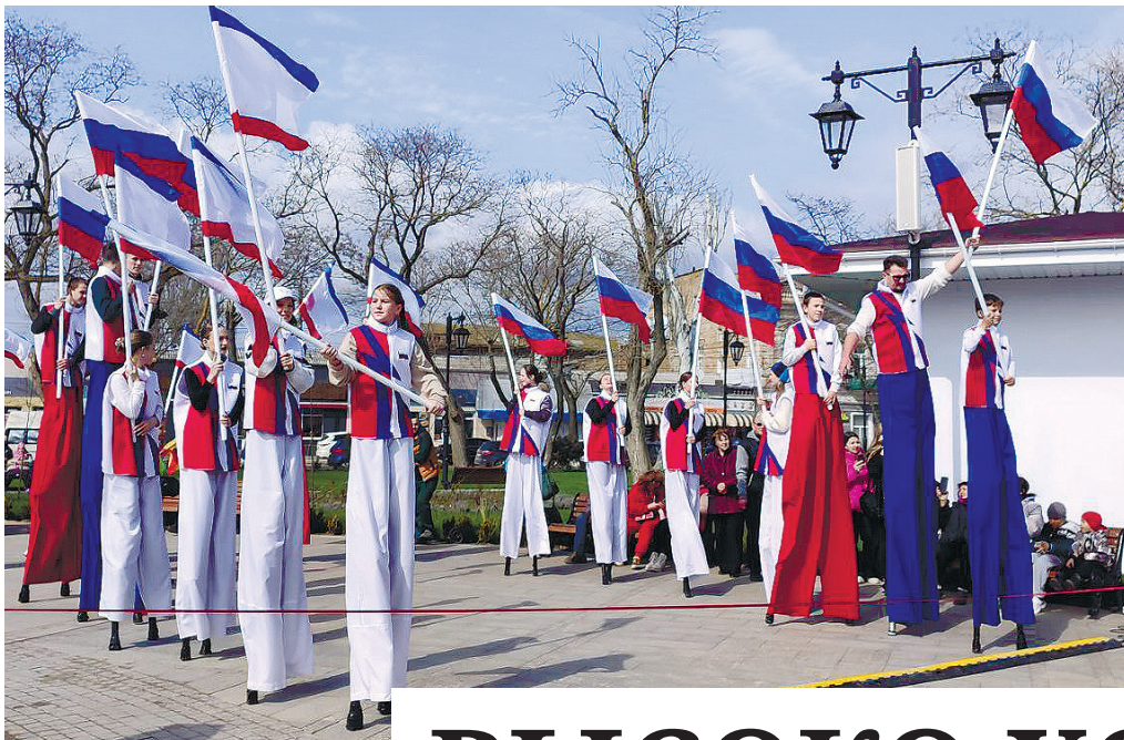
Финишировали «великаны»-рекордсмены на открытой набережной имени Валентины Терешковой.

Шествие ходулисты провели в формате эстафеты. Её маршрут был проложен по объектам, воссозданным или построенным за 10 лет, прошедших с момента воссоединения полуострова с Россией. Артисты прошли мимо местного Дворца спорта имени Юрия Гагарина, Мойнакского скейт-парка и сквера Ашика Умера. Финишировали «великаны» на недавно открытой набережной имени Валентины Терешковой. По