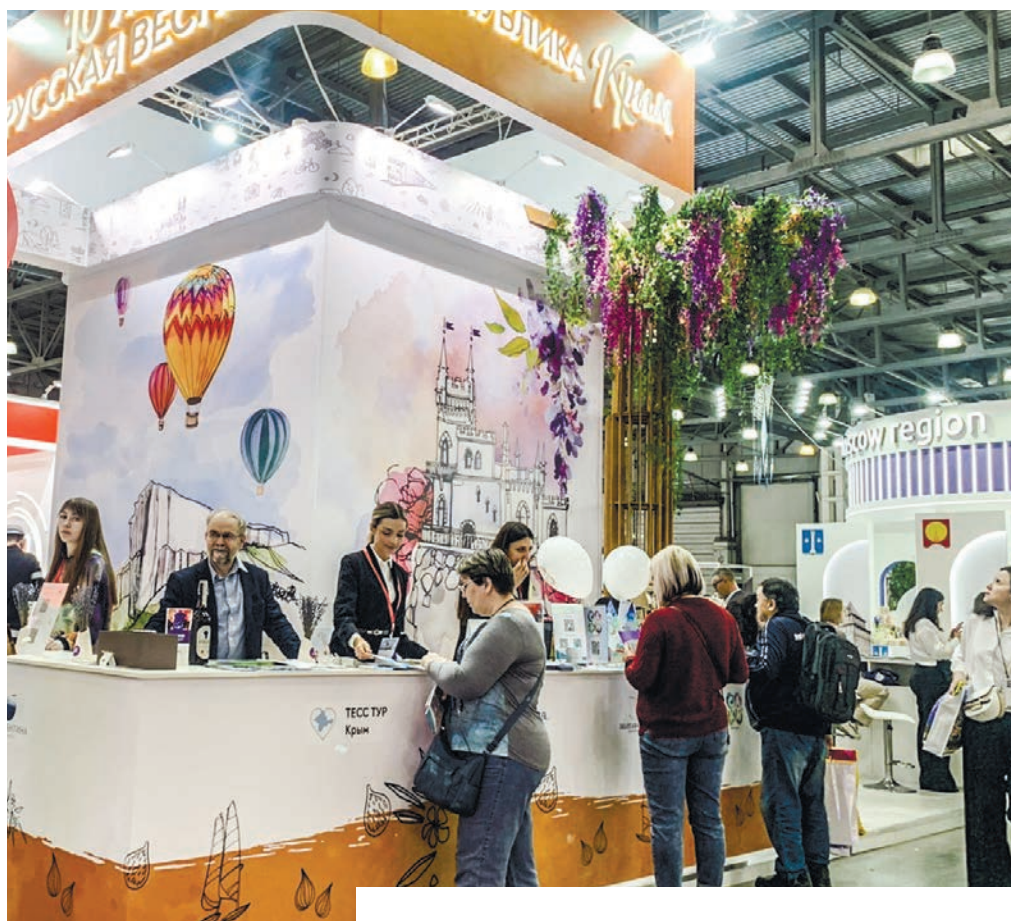
Республика Крым представлена единым стендом.

В эти дни в столице страны проходит важное для туристической сферы событие – в МВЦ «Крокус Экспо» презентуют лучшие места для отдыха. Наш курортный регион – в числе наиболее привлекательных.