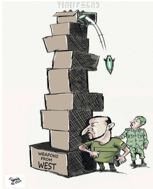
Карикатура: телеграм-канал «Телеграфля»

– Ну, загораю я на пляже... Закинул бабок на трубу, проверил мыло, отправил тёлке открытку, вызвал такси и лежу смотрю вчерашние новости... Один дед другому: – Я ж тебе говорил, Михеич, что они, городские, все на голову повёрнутые! *** Новый учитель, решив проверить уровень знаний в классе, спрашивает: – Дети, кто взял Бастилию? – Мы не брали... Учитель пошёл к директору и рассказывает ему это. Директор: – Да вы не расстраивайтесь. Если не вернут, в конце года спишем. *** – Здравствуйте, я хотел бы получить в вашем банке кредит, на 100 тысяч. – Хорошо, а с какой целью? – На лечение. – Нуу... поймите, для банка это невыгодно, предоставлять кредиты на такие суммы больным людям... – Ну, вы тоже поймите... у меня в вашем банке уже открыт ипотечный кредит на 3 миллиона, на 15 лет... так что подумайте, что для вас выгоднее.