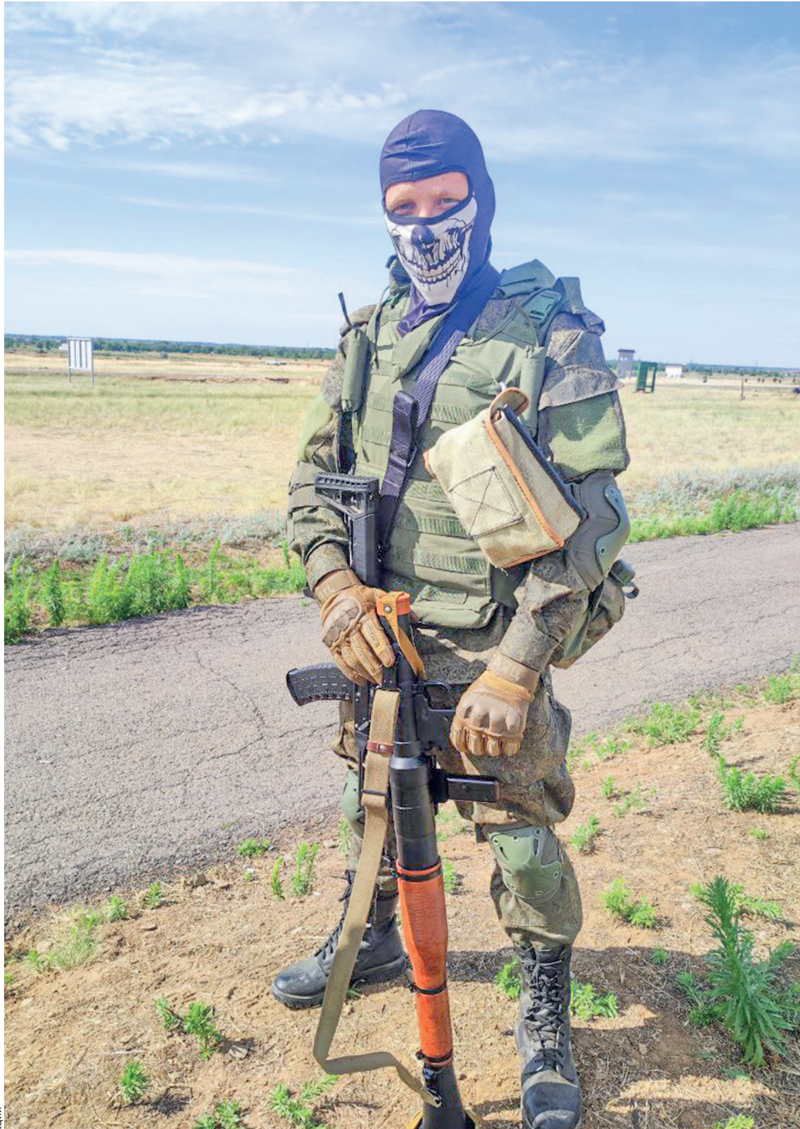
Фото героя публикации

Обмен первой группы бойцов прошёл благополучно, Арсен с