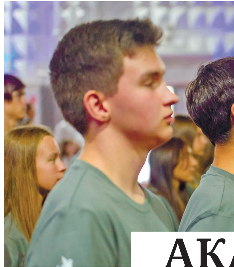
Участниками первой смены центра «Авангард» стали 100 старшекласников из Евпатории.

– Подобные центры запускают сегодня по всей стране... Это прекрасная инициатива, ведь в наше время одна из приоритетных задач государства – развитие у молодого поколения патриотических чувств, популяризация государственной и воинской службы. Для этого необходимо создавать подходящие условия: предоставлять возможность для обучения и проявления талантов и способ-