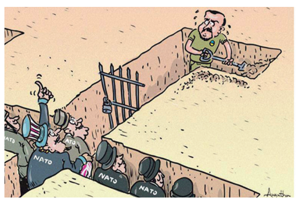
Карикатура: телеграм-канал «Телеграфля»