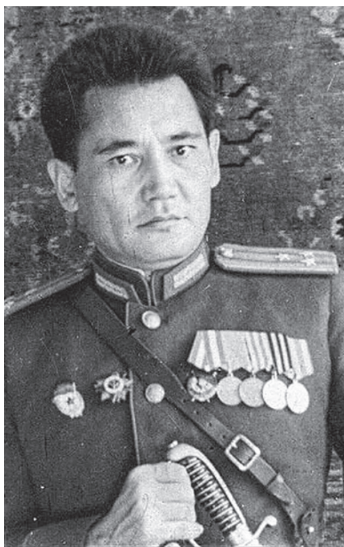
Полковник Бауыржан Момышулы.

“ В 1941 ГОДУ ЗА НИМ ЗАКРЕПИЛОСЬ ПРОЗВИЩЕ ДИКИЙ ЛЕЙТЕНАНТ. ПРИ- ЧИНОЙ СТАЛА РАЗРАБОТАННАЯ ИМ ТАКТИКА ВЫВОДА ПОДЧИНЁННЫХ ИЗ ОКРУЖЕНИЯ. ОНА ПРОТИВОРЕЧИЛА ВСЕМ ТЕОРЕТИЧЕ- СКИМ КАНОНАМ, НО ПРИ ЭТОМ ОКАЗА- ЛАСЬ НАСТОЛЬКО ЭФФЕКТИВНОЙ, ЧТО СВЕЛА ПОТЕРИ ПРАКТИЧЕСКИ К НУЛЮ!