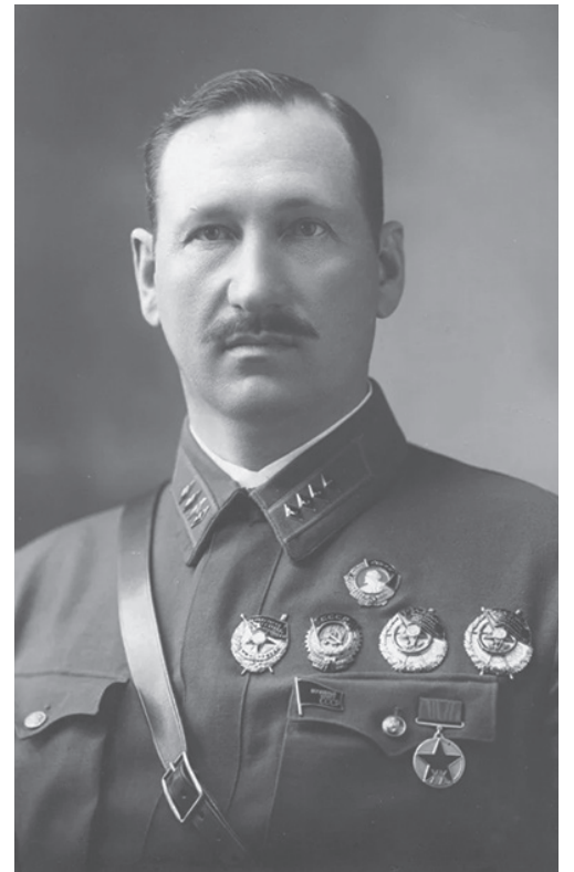
Генерал-лейтенант Михаил Ефремов.

“ ВМЕСТО СЕБЯ ОН ТОГДА ОТПРА- ВИЛ БОЕВЫЕ ЗНАМЁНА И НЕ- СКОЛЬКИХ РАНЕ- НЫХ СОЛДАТ. А САМ ПРИ ПРОРЫВЕ ИЗ ОКРУЖЕНИЯ ПОГИБ