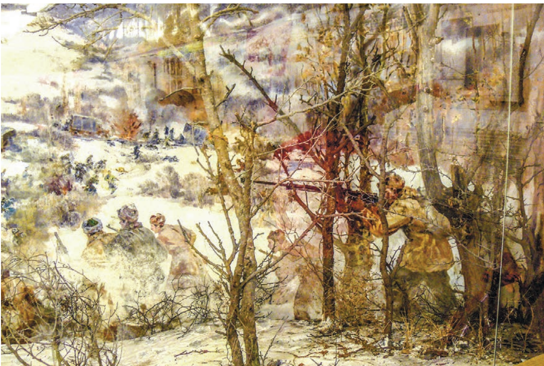
В музее села Партизанского Симферопольского района находится художественная панорама «Бешуйский бой», созданная на основании рассказов участников операции.