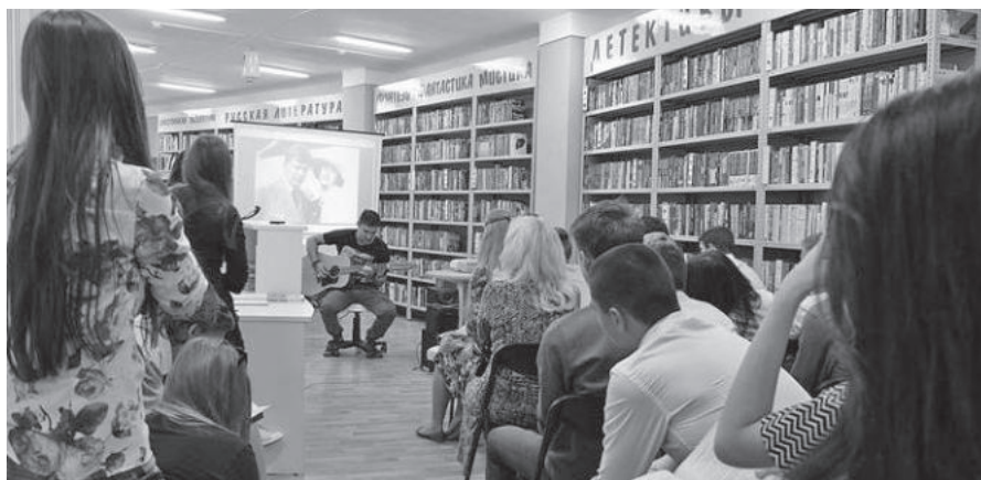
В Крымской республиканской библиотеке для молодёжи часто проводят тематические акции.

Читатели считают, что там работают компетентные и доброжелательные люди