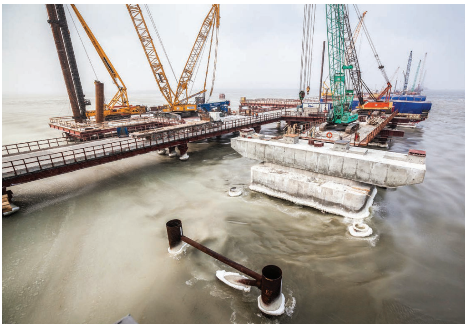
Устройство автомобильных и железнодорожных опор с рабочего моста № 1 между Тузлинской косой и одноимённым островом.

СЕВАСТОПОЛЬ. На полигоне Черноморского флота проходят учения противолодочных сил с привлечением новейшей дизельной подводной лодки «Старый Оскол» и морской авиации. «Корабельная противолодочная ударная группа в составе малых противолодочных кораблей «Суздалец» и «Муромец» осуществила поиск подводной лодки... и учебную атаку с применением торпедного оружия. Корабли в ходе поиска взаимодействовали с противолодочными самолётами-амфибиями и вертолётами морской авиации флота», – сообщили в пресс-службе ЧФ.