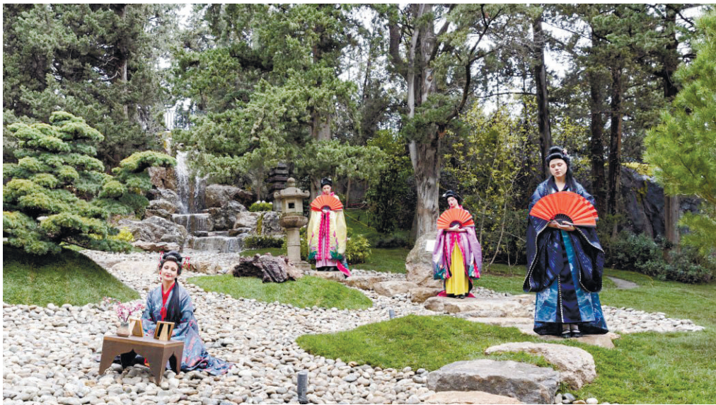
На территории Воронцовского дворца разбили куртину в стиле японского сада.