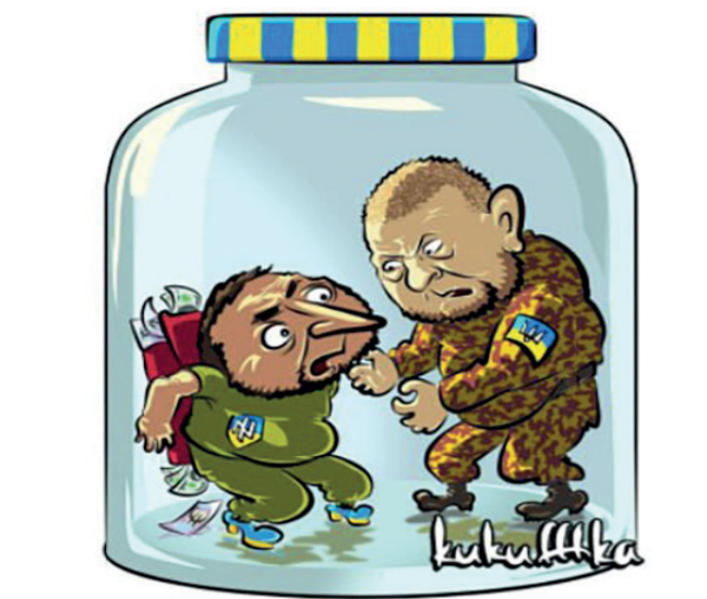
Карикатура: телеграм-канал «Нос»

В банке заперто ворьё, Каждый говорит: «Моё!»