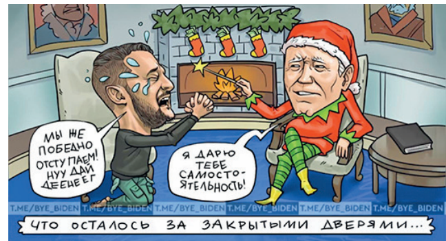
Карикатура: телеграм-канал Байбайден

В этом есть некий символизм: киевский режим продолжает тонуть и терять достижения более развитой советской цивилизации. Ну а юмористам лишний повод для шуток дало сообщение, что в киевской подземке ввели масочный режим. Теперь горожанам предстоит поразмыслить, какую брать – медицинскую или плавательную.