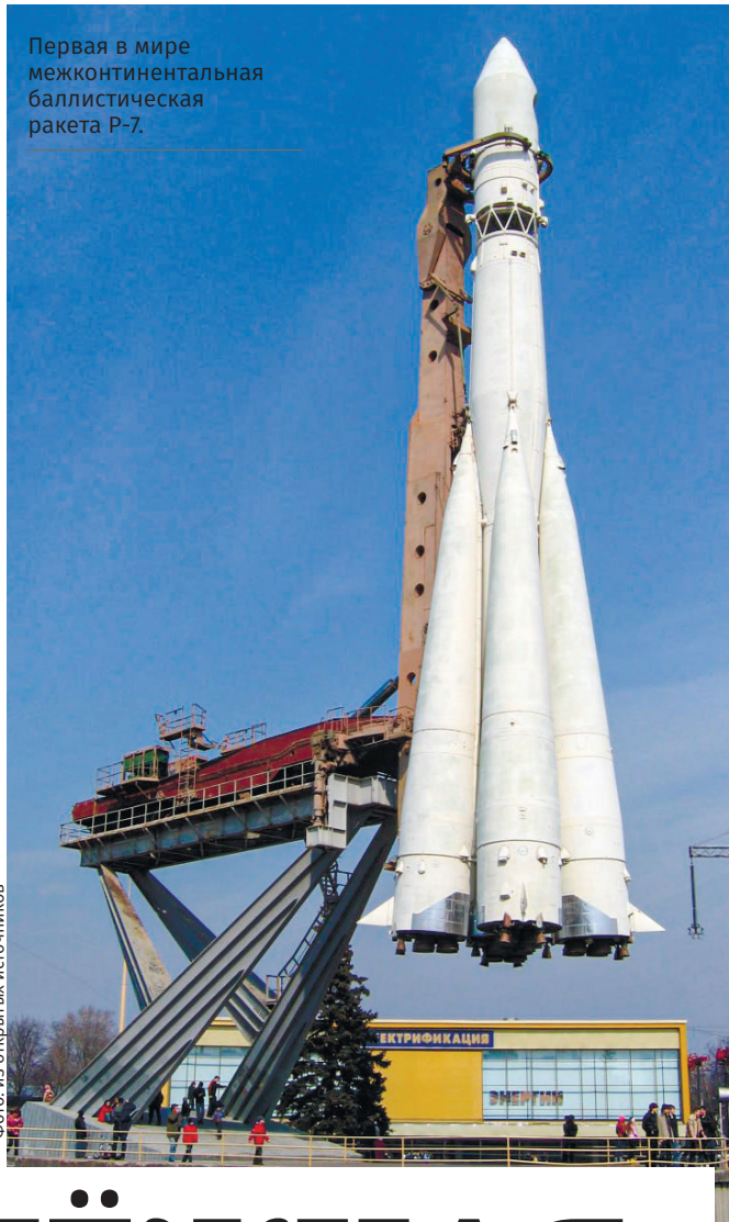
Первая в мире межконтинентальная баллистическая ракета Р-7.

В самый разгар холодной войны политическое руководство СССР вынуждено было задуматься о создании надёжных средств для нанесения ответного ядерного удара по территории США – нашего главного геополитического соперника. Так как в стратегической авиации потенциальный противник имел большое