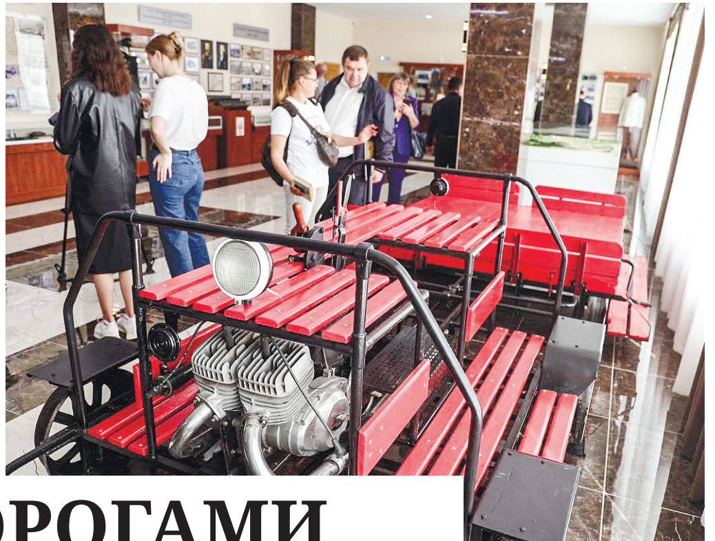
В музее более 100 экспонатов, самый заметный – дрезина.

Поводов для создания музея несколько, главные – 10-летие КЖД и 150-летие первого поезда в Крым. К его организации причастны со-