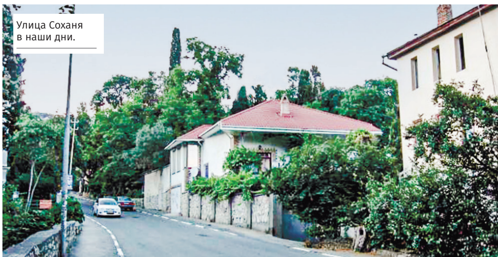
Улица Соханя в наши дни.