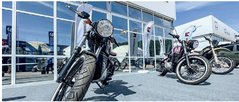
Фото: концерт «Калашников»