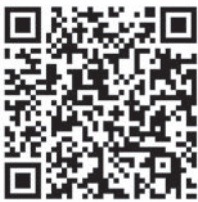
На правах социальной рекламы

ПОБЕДА БУДЕТ ЗА НАМИ! СЛУЖБА ПО КОНТРАКТУ ЗВОНИ 117 (звонок бесплатный) Приходи в военный комиссариат по месту жительства или пункт отбора: г. Симферополь, ул. Киевская, д. 152 8 (3652) 66-85-71