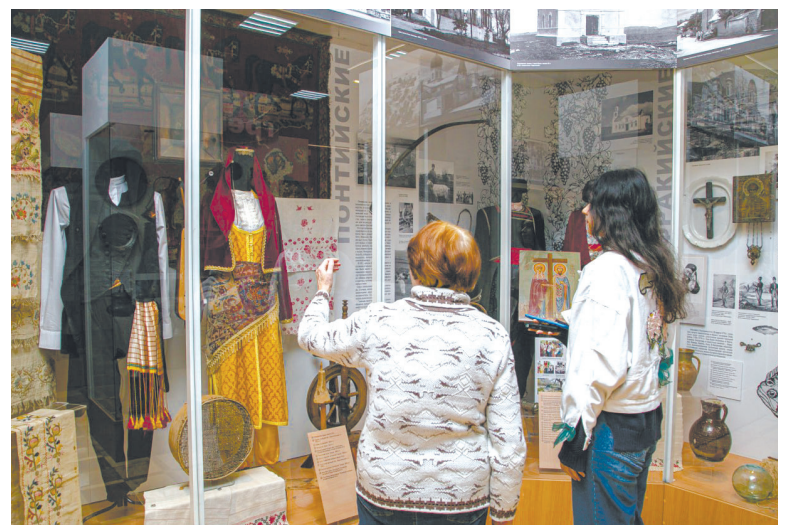
День народного единства – отличный повод посетить Крымский этнографический музей.

В Крымском этнографическом музее представлены костюмы греков периода XVIII и XX веков – драпировочные, отличающиеся тем, что никогда не кроились и почти не шивались и вместе с тем имели много слоёв. Это рубаха, сарафан или курточка, сверху – фартук и пояс. У российских греков интересной осо-