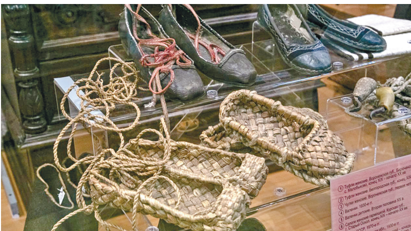
Традиционная русская обувь – это лапти.