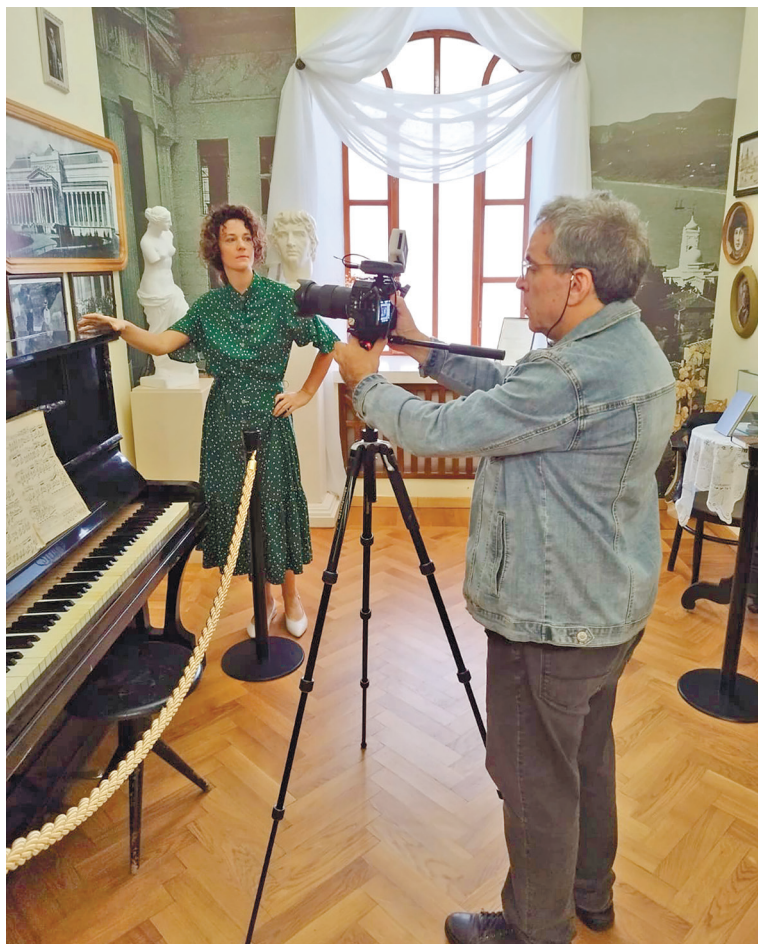
Съёмки в Музее Марины и Анастасии Цветаевых.

Кинооператор проекта Илья Шпиз окончил ВГИК в 1989 году и за свою творческую карьеру снял