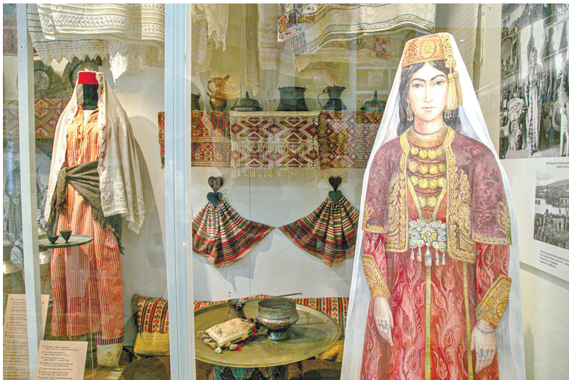
Монеты входили в состав нагрудного украшения под названием герданлык – бархатная основа с нашитыми монетками закрывала вырез платья на груди.

Головные покрывала, тканые на станке, носили замужние женщины, а вот вышитые кисейные предназначались юным де-